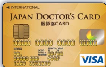
新ゴールドカード