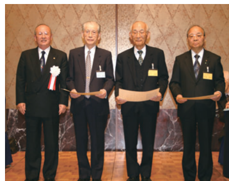
表彰式(右から1番目が伊東理事長)