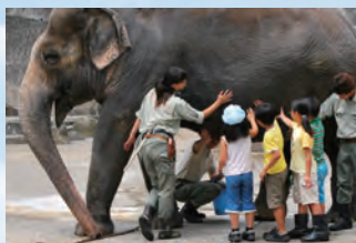
読売新聞社賞 「皆でさわって大きな命を感じたよ！」 中込 隆